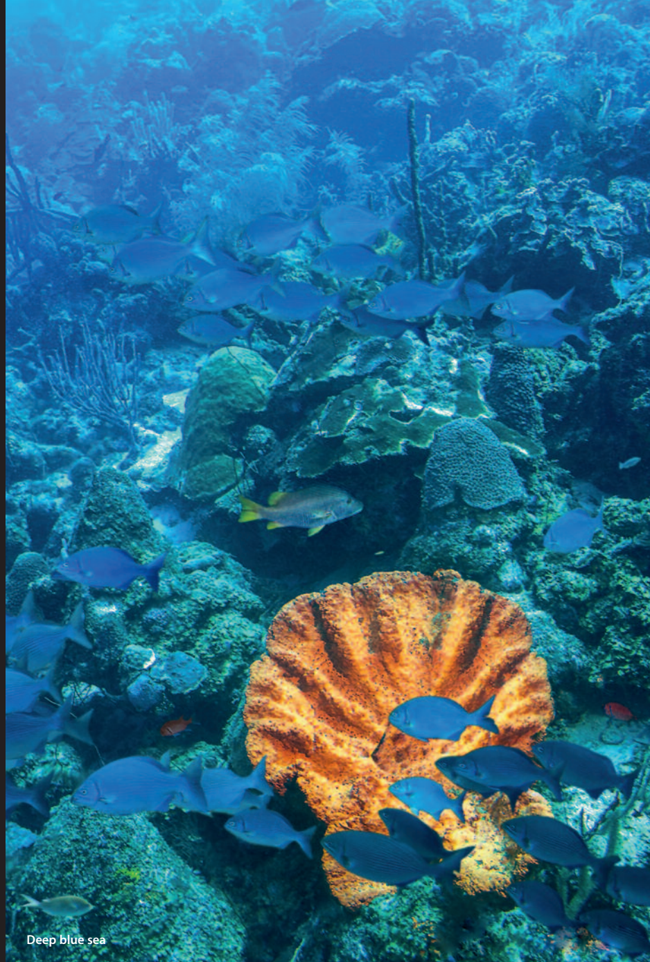
Deep blue sea

Voor meer informatie: www.moniqueharbers.com