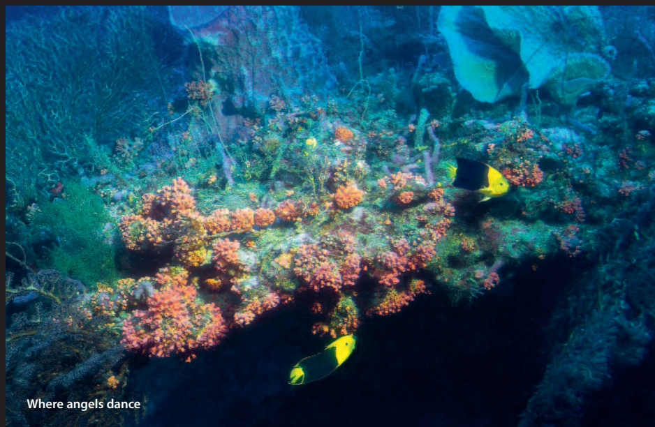
Where angels dance