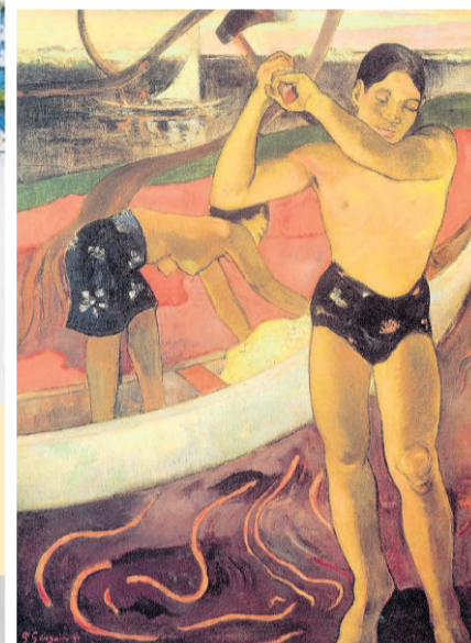
L'Homme à la hache van Paul Gauguin uit 1891