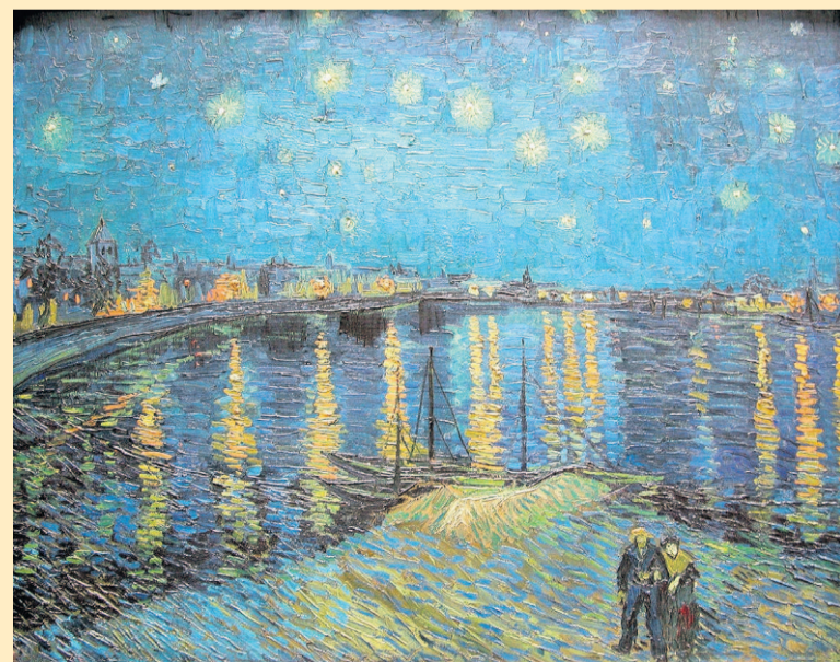
Sterrennacht boven de Rhône, Vincent van Gogh, 1888.